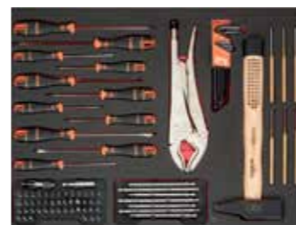
ЛОЖЕМЕНТ 26" Размеры: 543 x 445 мм