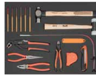
ЛОЖЕМЕНТ 26" Размеры: 543 x 445 мм