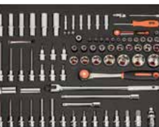
ЛОЖЕМЕНТ 26" Размеры: 543 x 445 мм

Предложение действительно с 1 апреля 2017 года по 31 июля 2017 года. Рекомендованная розничная цена, включая НДС. Предложение ограничено.