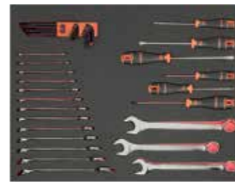
ЛОЖЕМЕНТ 26" Размеры: 543 x 445 мм