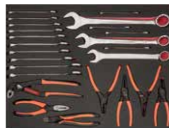
ЛОЖЕМЕНТ 26" Размеры: 543 x 445 мм