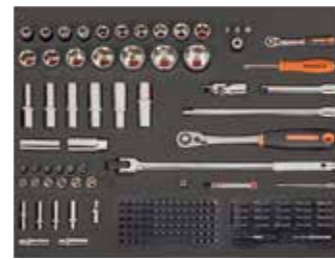
ЛОЖЕМЕНТ 26" Размеры: 543 x 445 мм

Предложение действительно с 1 апреля 2017 года по 31 июля 2017 года. Рекомендованная розничная цена, включая НДС. Предложение ограничено.